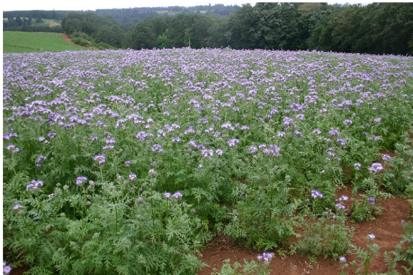
図 1. 開花期のハゼリソウ